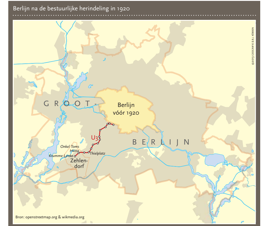
Bron: openstreetmap.org & wikimedia.org

Maar wie moest de woningbouw realiseren? Van de particuliere bouwers viel niet veel te verwachten. Tot de Eerste Wereldoorlog domineerden Terraingesellschaften samen met kleine en middelgrote bouwbedrijven de woningontwikkeling in Berlijn. Deze privéondernemingen kochten grond aan, maakten die bouw- en woonrijp en zorgden voor doorlevering aan particulieren die daar hun eigen huis konden realiseren. Na de Eerste Wereldoorlog ontbrak het echter aan kapitaal en bouwmaterialen. De bouwsector had een nieuwe impuls nodig.