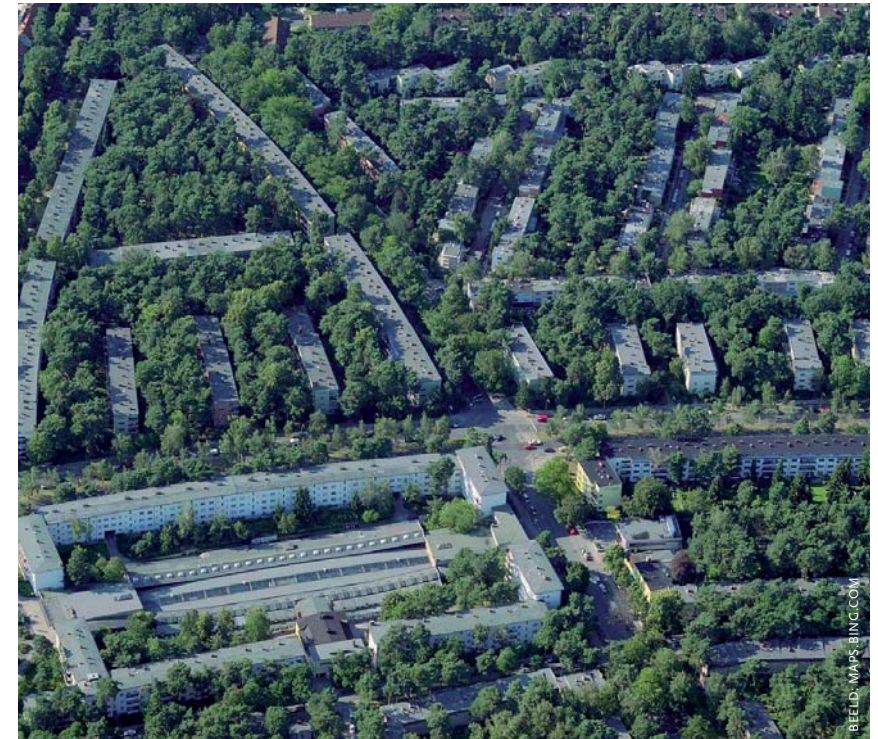
Model van de Grosssiedlung Onkel Toms Hütte, met parallelle etagebouw en groene stroken daartussen.

van de residuele grondwaarde. Dit is de waarde die resteert nadat (geschatte) opbrengsten en kosten van een bouwprogramma tegen elkaar zijn weggestreept. Het residu vormt dan de grondprijs. Woningbouwcorporaties probeerden bij de aankoop van grond het residu zo klein mogelijk te houden: ze overdreven de kosten en schatten de opbrengsten laag in. Deze begrijpelijke reflex voerde de woningbouwcorporatie weg van de traditionele en beperkte rol als sociaal aanbieder van goedkope woningen. Het sturen op de bouwkosten bleef lang onderbelicht.