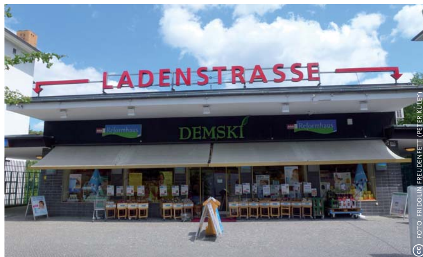
Het metrostation Onkel Toms Hütte ligt in een overdekte goot en heeft een eilandperron. In het dak zit een glazen koepel, waardoor er daglicht op het perron valt. Parallel aan de sporen zijn winkelpassages ( Ladenstraßen ) aangelegd.

Vanaf de Kurfürstendamm brengt U-Bahn 3 je in een halfuur naar eindstation Krumme Lanke in het zuidwesten van Berlijn. Vanaf station Thielplatz reis je 3 kilometer over een met private middelen gefinancierd spoor. De ruwbouw van het spoor, kosten van de grond en bouw van het eindstation kwamen rond 1925 voor rekening van de bouwondernemer Sommerfeld. Gelijkertijd bedong hij een concessie van het gemeentelijk vervoerbedrijf, de Hochbahngesellschaft, voor de commerciële exploitatie van het voorlaatste station, Onkel Toms Hütte. Met winkels, bioscoop, garage, woningen en postkantoor wilde Sommerfeld dit station tot middelpunt van een suburbane ontwikkeling maken, een Multifunktions-, Konsum- und Wohn-Komplex .