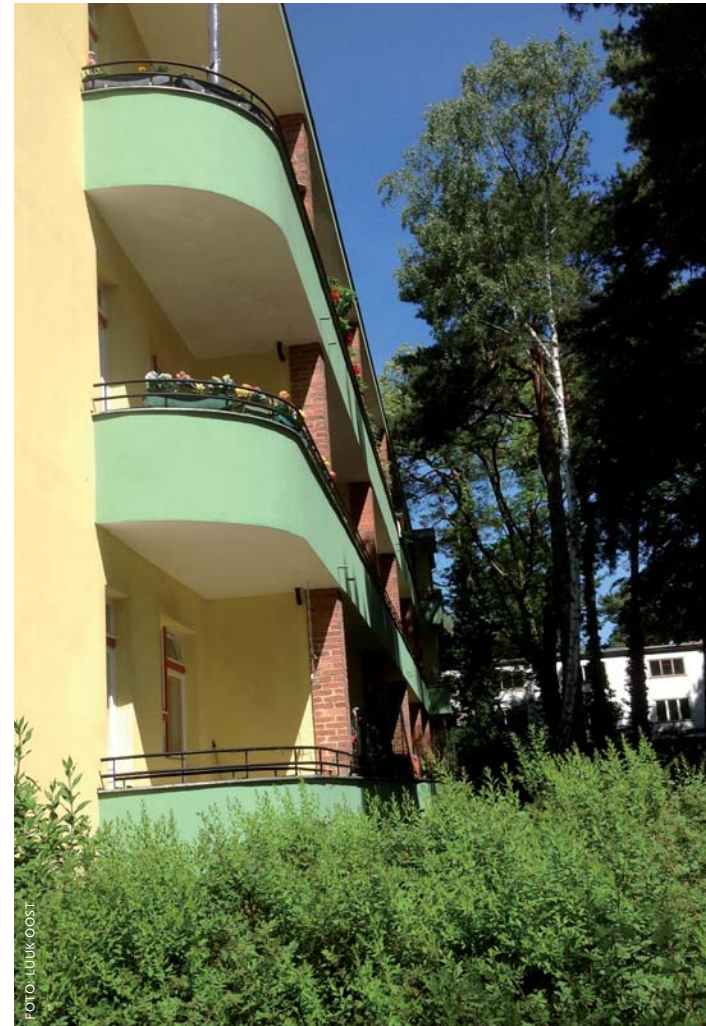
Etagebouw in de directe omgeving van metrostation Onkel Toms Hütte. De balkons en loggia's van de appartementen zijn 'democratisch' op zon en licht georiënteerd, zodat ieder gezin ervan kan profiteren.

Dankzij een bestuurlijke herindeling in 1920 omvatte 'Gross-Berlin' plotsklaps meer dan 800 km 2 in plaats van 60 km 2 . Vanwege de enorme problemen op de binnenstedelijke woningmarkt kwam